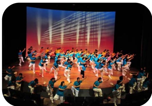
7歳～80代まで一緒にの舞台を楽しみます！

★「気功健康セミナー&ヒーリングステージ」は、自分の「いのち」を慈しみ、心身共に健康で生き甲斐のある暮らしをめざし、日々、気功を実践している仲間が集まり、毎年秋に開催している「参加型ステージ」です。セミナーでは、様々な分野でご活躍中の先生方をお呼びして貴重な講演を頂き、新しい気付きや学びを共有しています。ステージは広く一般にも公開しており、毎年好評を頂いております。皆様のご来場を心よりお待ちしております。(写真は昨年のステージより)