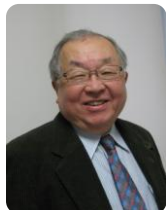
[帯津良一プロフィール]

1936年生まれ。東京大学医学部卒。医療法人直心会帯津三敬病院名誉院長。帯津三敬塾クリニック理事長。NPO法人心とからだの研究会特別顧問。日本ホリスティック医学協会会長。日本ホメオパシー医学会理事長。人間をまるごと捉えるホリスティック医学の第一人者。西洋医学のみならず中国医学や代替療法などを取り入れた統合医療を実践し、がん患者などの治療にあたる。最近の著書に『太極拳養生法』(春秋社)があり、他、著書多数。