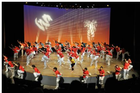
8歳~80代まで一緒にの舞台を楽しみます!

「気功健康セミナー&ヒーリングステージ」は、自分の「いのち」を慈しみ、心身共に健康で生き甲斐のある暮らしをめざし、日々、気功を実践している仲間が集まり、毎年秋に開催している「参加型ステージ」です。セミナーでは、様々な分野でご活躍中の先生方をお呼びして貴重な講演を頂き、新しい気付きや学びを共有しています。ステージは広く一般にも公開しており、毎年好評を頂いております。皆様のご来場を心よりお待ちしております。(写真は今年のステージより)